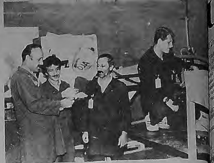
Sendikal eğitim üretim anında da yapılıyor

yiz. Bu niteliklerimiz, kısaca örgütlülüğümüz, sendikamızın engellemelerine rağmen, işverenle pazarlığımızı artırıyor. Aramızda birleşme, dayanışma duygularını geliştiriyor. Ve sorunlara tavırımız net ve kesin oluyor."