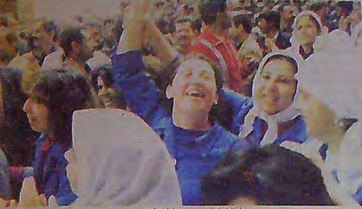
Ekmezi son lokmasını kadar paylaşmayı da, ağır dolusu gülmeyi de biliriz.

● Mart, Nisan aylarında gelişen işçi eylemlilerinde kadınlar en ön saflardaydılar. Bu öncülük işçi sınıfının mücadelesinde kadın işçilerin önemini bir kez daha gösterdi.